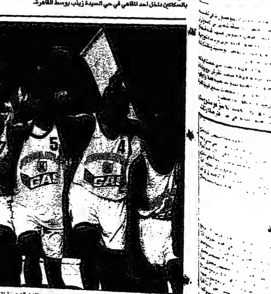
فرحة لاعبي منتخب يوغوسلافيا بالفوز ببطولة أوروبا لكرة السلة (ديوت)

توتلينجن (ألمانيا). 1- ف بد فاف يابون ميونخ الانكليسي على فنزويشة التركي 2-صفر في مباراة كرة القدم الودية في توتلينجن (جنوب ألمانيا) امام 15 ألف متفرج استعددا للتوري الالمني الذي يبدأ في 2 (أغسطس) المقبل.